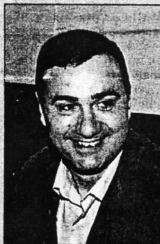
El concejal del Bloque critica a UN