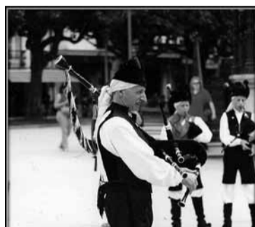
Tras la finalización de la actuación de las bandas comenzará la CENA-BAILE, con la celebración de la IV Fiesta del Churrasco