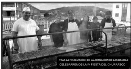
TRAS LA FINALIZACIÓN DE LA ACTUACIÓN DE LAS BANDAS CELEBRAREMOS LA IV FIESTA DEL CHURRASCO