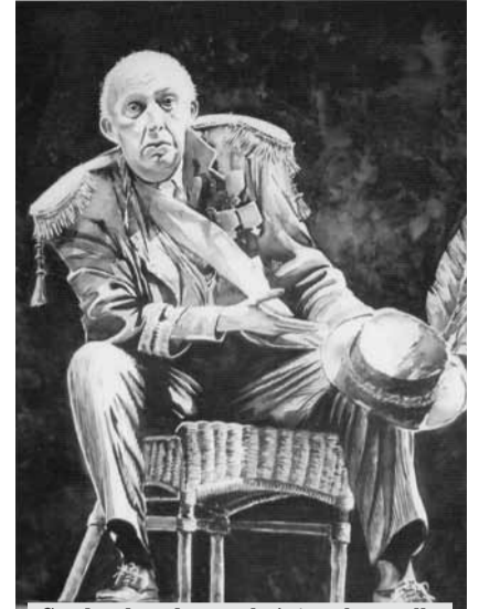
Cuadro donado por el pintor al concello

Al final del acto se procedió a unos aperitivos acompañados de un vino.